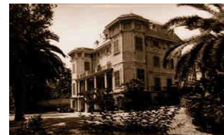
Villa Nobel i San Remo.

Årets möte är inget undantag. Hittills har vi 18 pappers anmälda och godkända att avhandla under två, som det ser ut, intensiva dagar. Vill du veta mer om innehållet så kan du kontakta hans.ahlgren@kcem.se eller gå in på vår hemsida. /HA