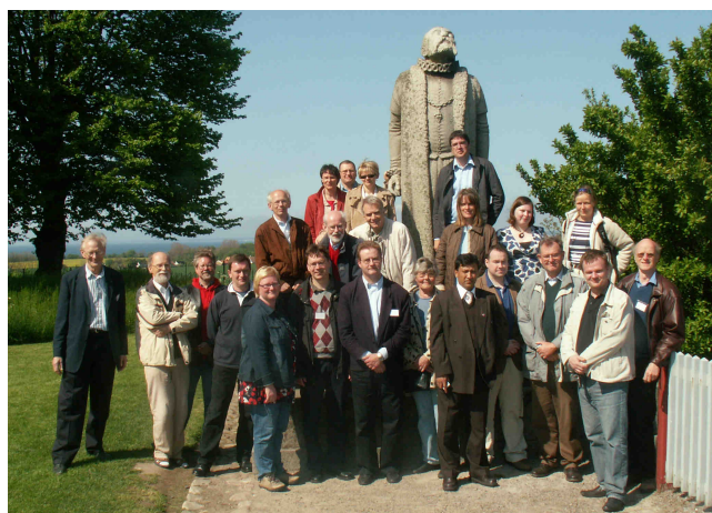
Bild på hela gruppen vid utflykten till Ven. Statyn föreställer