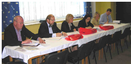
I samband med konferensen sammanträdde partner i EUExcerts Workpackage som handlar om utbildningsfrågor.